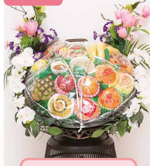
果物 A メロン