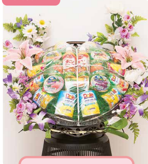
缶詰 B ポンジュース