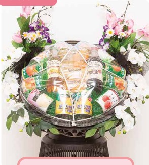
缶詰 A グレープジュース